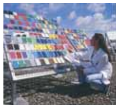
Folien beim Bewitterungstest

На основании необычайной стойкости к атмосферному воздействию и долговечности RENOLIT AG дает десятилетнюю гарантию на пленку RENOLIT FAST при использовании на территории Европы и пятилетнюю – на территории всего мира.